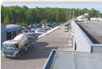
Material aufs Dach

Einsatzvorschläge: GaLa- Bau - Flachdachbegrünung - Gabionenbefüllung - Hinterfüllungen - Betonförderung