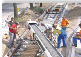
Band beim Gleisbau