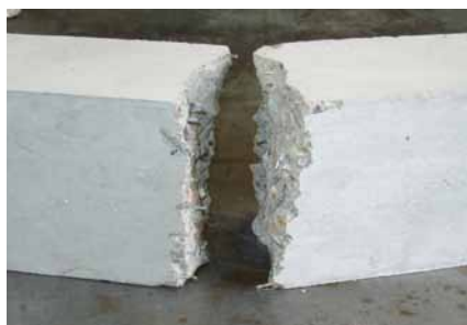
Probekörper (Balken nach Versuch)