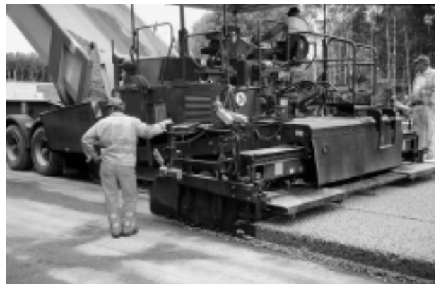
Bild 1: Einbau einer Dränbetontragschicht im Beschleunigungstreifen einer Autobahn-Anschluss-Stelle

Unter Betondecken muss der innere Rand der DBT beim Neubau mindestens 20 cm Überstand zur darüberliegenden Längsfuge der Betondecke (z.B. zwischen Standstreifen und LKW-Fahrstreifen) aufweisen, um Sickerwasser sicher aufnehmen zu können. Wird die DBT und/oder die benachbarte Tragschicht im Baumischverfahren hergestellt, sollte die DBT zunächst 50 cm über die Fuge hinaus angeordnet werden. Nach Einbau der benachbarten Tragschicht „frisch in frisch“ wird ein ca. 30 cm breiter Übergangsbereich zwischen Tragschicht und DBT nochmals durchgefräst, um gleichmäßige Auflagerbedingungen und einen 20 cm breiten dränfähigen Bereich zu erhalten.